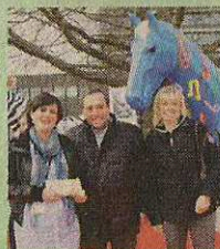
Gattermann Projekt GmbH