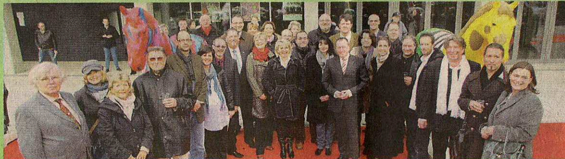
Pferdepaten und Künstler trafen sich gestern vor der Volkswagen Halle zur Pferdetaufe.

ins Leben gerufen. Im Beisein von Paten, Künstlern und Organisatoren dieser Aktion wurden die farbenfrohen Tiere noch einmal ausgiebig in Augenschein genommen – und in einer Sache waren sich alle sofort einig: dieses Projekt ist gelungen und hat geholfen das eine oder andere emotionale Verhältnis entstehen zu lassen.